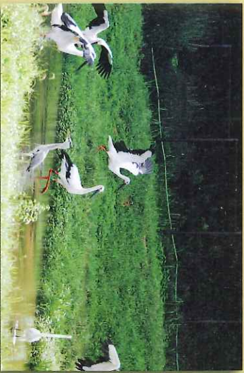
コウノトリの郷公園に飛来するコウノトリ