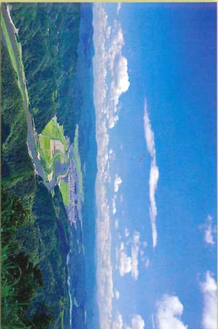
来日山から円山川を望む